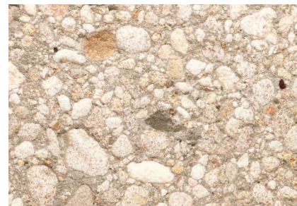
Agrégats Delsberger sablé / gravier 0-30 mm