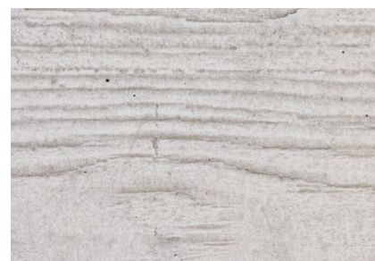
Béton gris structure des planches