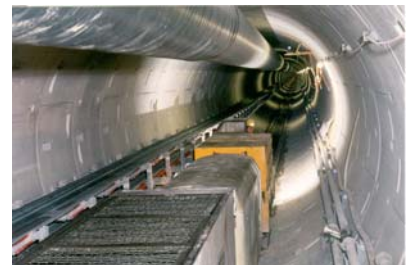
Tunnel en construction