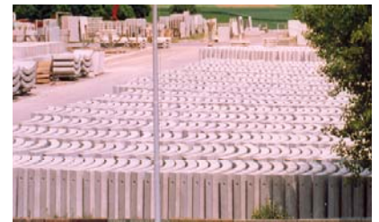
Voussoirs sur la place de stockage