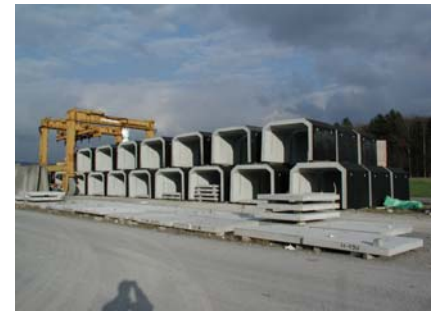
Éléments sur la place de stockage