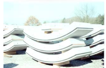
Anneaux de voussoirs stockés sur la place de stockage et prêts à être montés