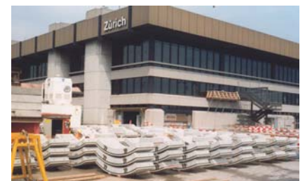
Stockage intermédiaire à l'aéroport