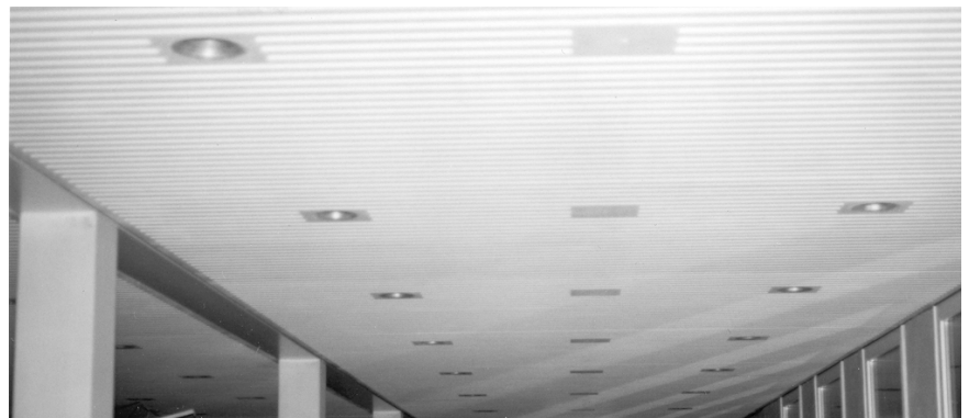
Face inférieure du plafonds