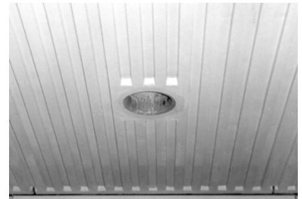
Vue des nervures