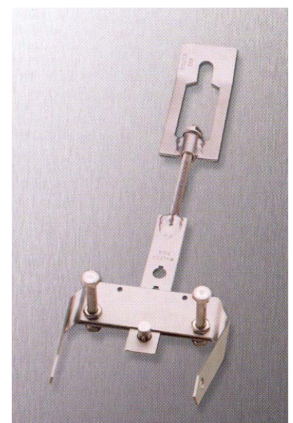
Ancrage de façade