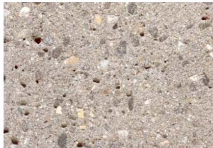
Béton gris Sablé Gravier 0-16