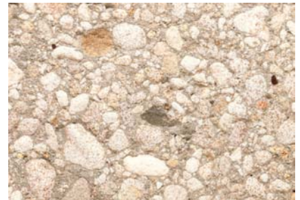
Agrégats Delsberger Sablé Gravier 0-30 mm