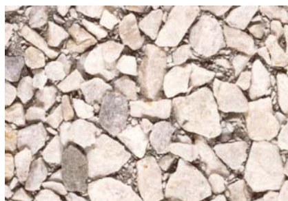
Agrégats Quarzit Lavé Gravier 0-15 mm