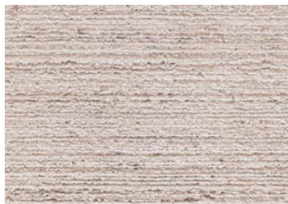
Béton gris Balayé