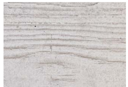
Béton gris Structure des planches