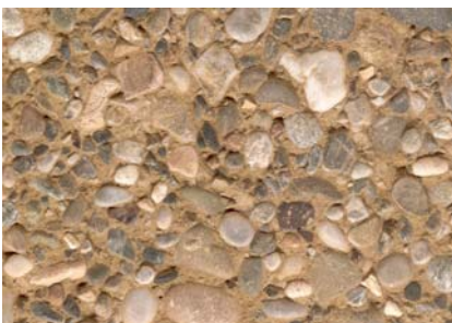
Béton coloré 4% jaune brossé Gravier 0-30 mm