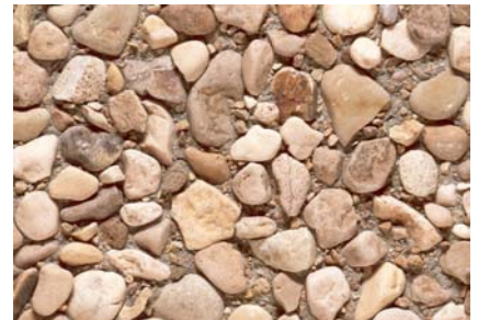
Agrégats Delsberger Lavé Gravier 0-4 / 8-16 mm