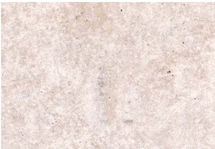
Béton gris lisse de décoffrage