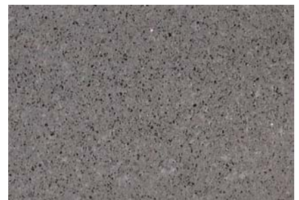
Béton coloré noir Passé à l'acide et imperméabilisé Additions de basalte + Scorall

Elément SA Tavel Mariahilfstrasse 25 1712 Tavel