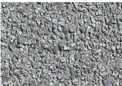
Agrégats Granit Lavé