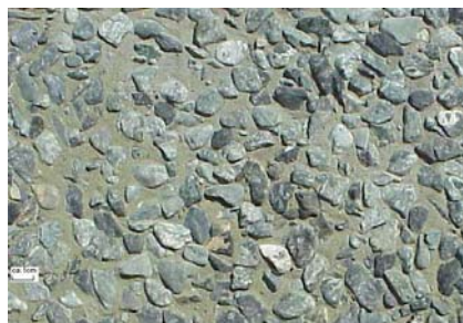
Agrégats Verde Alpi vert Lavé