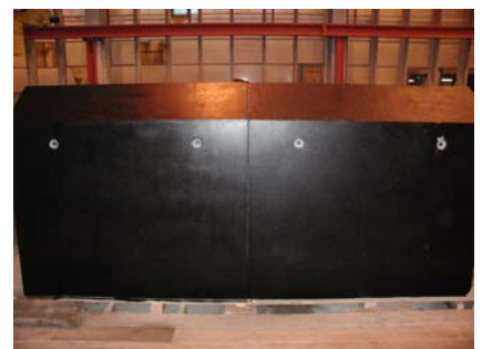
Probemontage im Werk