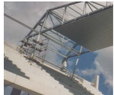
Verbindung Tribüne mit Dachkonstruktion