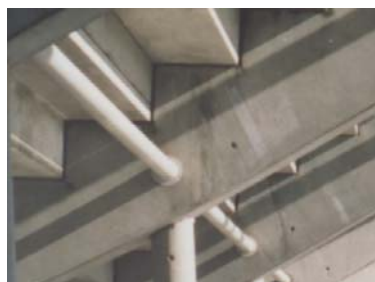
Verbindung Sägeträger mit Stahl-Mittelstütze