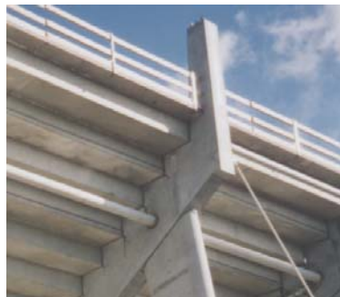
Verbindung Sägeträger mit hinterer Betonstütze