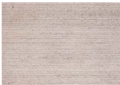
Beton grau Besenstrich