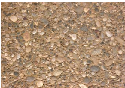
Beton eingefärbt 4% gelb Gebürstet Kies 0-30 mm