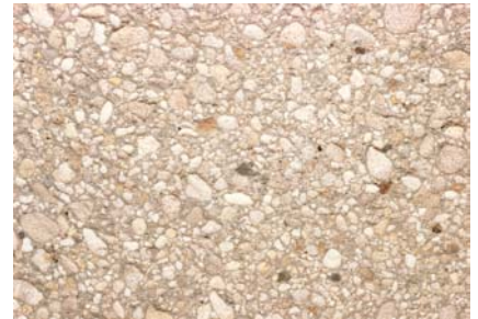
Vorsatz Delsberger Sandgestrahlt Kies 0-30 mm