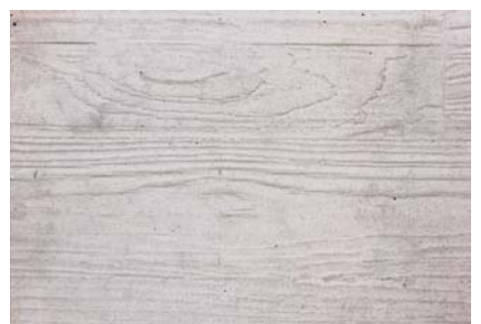
Beton grau Bretterstruktur