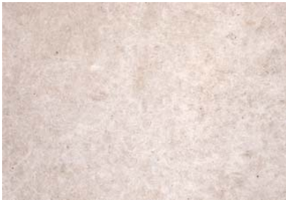
Beton grau Schalungsglatt