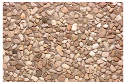
Vorsatz Delsberger Gewaschen Kies 0-4 / 8-16 mm