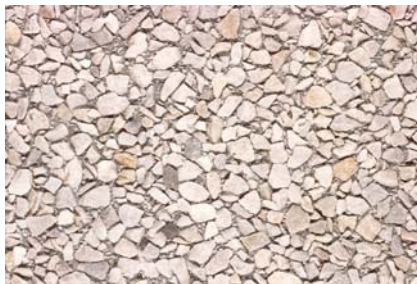
Vorsatz Quarzit Gewaschen Kies 0-15 mm