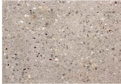
Beton grau Sandgestrahlt Kies 0-16