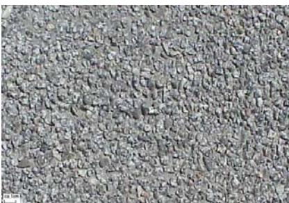
Vorsatz Granit Gewaschen